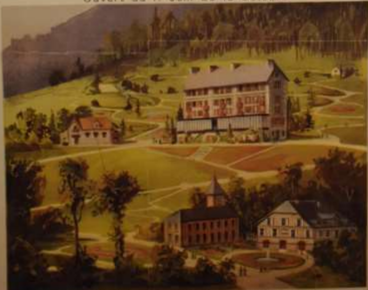
Vue du Grand Hôtel de la Compagnie du Chemin de fer d'Orléans.