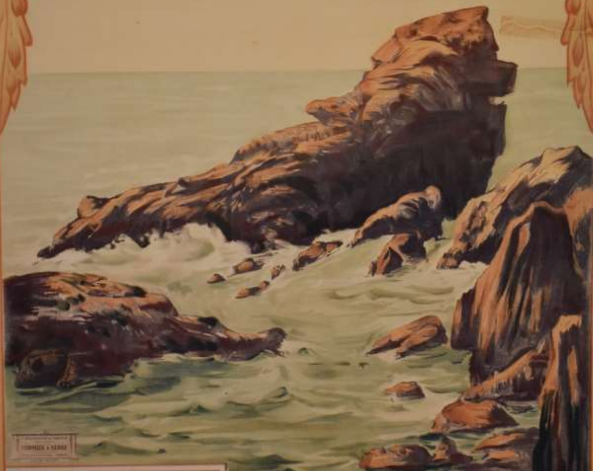
TOURNAI & SERRÉ