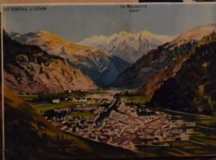
Vue générale de Luchon

AVIS — En voyant indiquant en détail les prix et les conditions dans lesquelles sont délivrés les différents billets indiqués ci-dessus ont été envoyés FRANCO à toute personne qui en fait la demande à la Compagnie des Chemins de fer du Midi. Cette demande peut être adressée soit au BUREAU COMMERCIAL DE LA COMPAGNIE, 94, BOULEVARD MAUBERT, A PARIS, soit au BUREAU DES TARIFS, RUE DE LA GARE, A BORDEAUX.