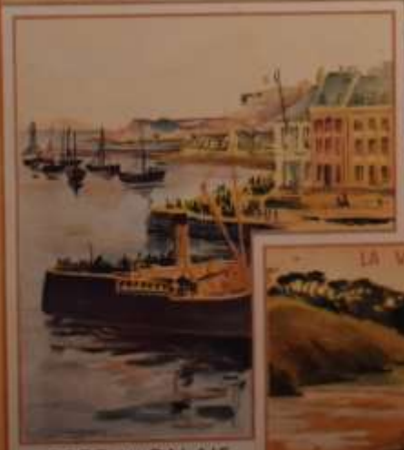
PORT DU PALAIS