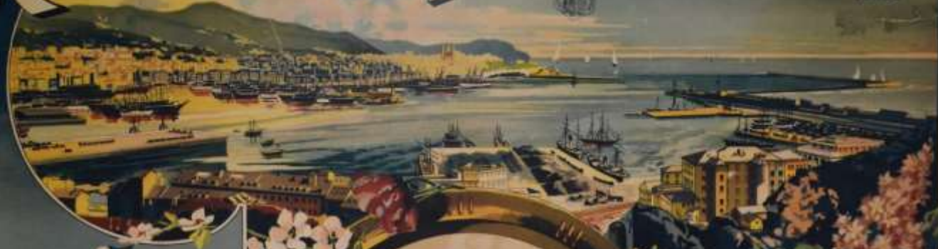
Venit - Suse Cortina - Aoste