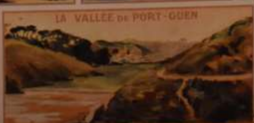
LA VALLEE DE PORT-GUEN