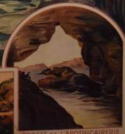
GROTTE DE L'APOTHECAIRERIE

SYNDICAT D'INITIATIVE DE BELLE-ISLE EN MER