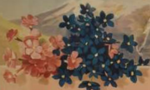
FIG. de GEN. 51817